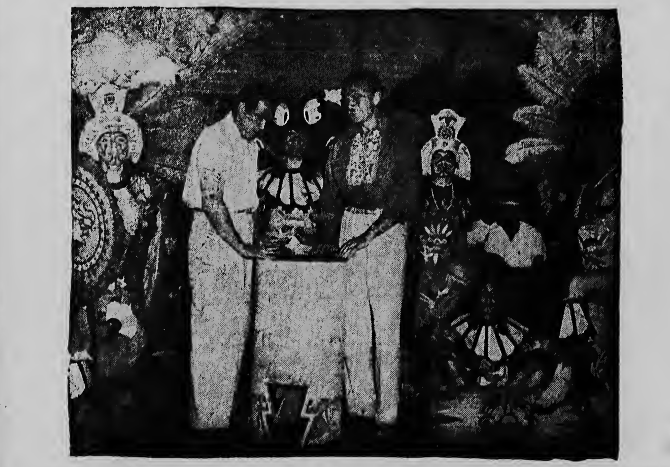
Gary Cooper (rechts), een vaste bezoeker van Mexico, in de Mexicaanse nachtelub Guernavaca, samen met zijn collega-acteur Johnny Qu Inn. Zij lieten zich overhalen om de muziek te helpen schrijven en de antieke drum te bespelen. De geschilderde man, die een Aztec-rijder voorstelt, compleeteerde de vloerghou.

If you feel old before your time or suffer from nerve, brain and physical weakness, you will find new happiness and health in an American medical discovery which restores youthful vigour and vitality quickly - that gland restorer which is a simple home treatment in tablet form, discovered by an American doctor. Absolutely harmless and easy to take, but the most powerful invigorator known to science. It acts directly on your glands, nerves, and vital organs, builds new, pure blood, and works so fast that you can see and feel new body power and its natural action on glands and nerves, your brain power, memory and eyesight, often improve amazingly. And this amazing new gland and vigour restorer, called VI-TABS, is guaranteed. It has been tested and proved by thousands and is now available at all chemists here. Get VI-TABS from your chemist today. Put it to the test. See the big improvement in 14 hours. Take the full bottle, which lasts eight days, under the positive guarantee that it must make you feel of vigour, energy and vitality and feel 10 to 20 years younger or money back on return of empty bottle. The guarantee is in full. Little and the guarantee is in full. Little and the guarantee is in full. VI-TABS Restores Blood and Vigour